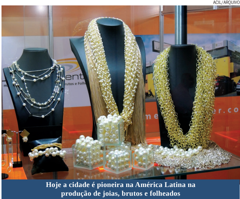
Hoje a cidade é pioneira na América Latina na produção de joias, brutos e folheados

No dia 15 de setembro Limeira completa 190 anos de existência, sendo destaque em seus primórdios pela grande produção de café, laranjas e cana-de-açúcar. A cidade surgiu historicamente em 1826, após a construção da estrada Morro Azul – Campinas, para escoar toda a produção dos engenhos da região. Em 1830 foi oficializada a freguesia de Nossa